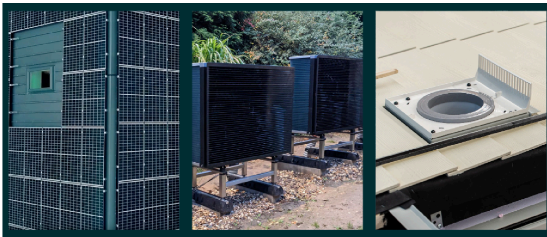
Abbildung 5: Serielle Sanierung - Wärmepumpen, Solaranlagen und Lüftungen mit Wärmerückgewinnung

Von ecoworks werden die gemäß GEG geforderten 65% erneuerbarer Energien problemlos durch die Kombination einer Photovoltaikanlage, einer Wärmepumpe und der Wärmerückgewinnung der Lüftungsanlagen erreicht, siehe Abbildung 5 und Abbildung 6.