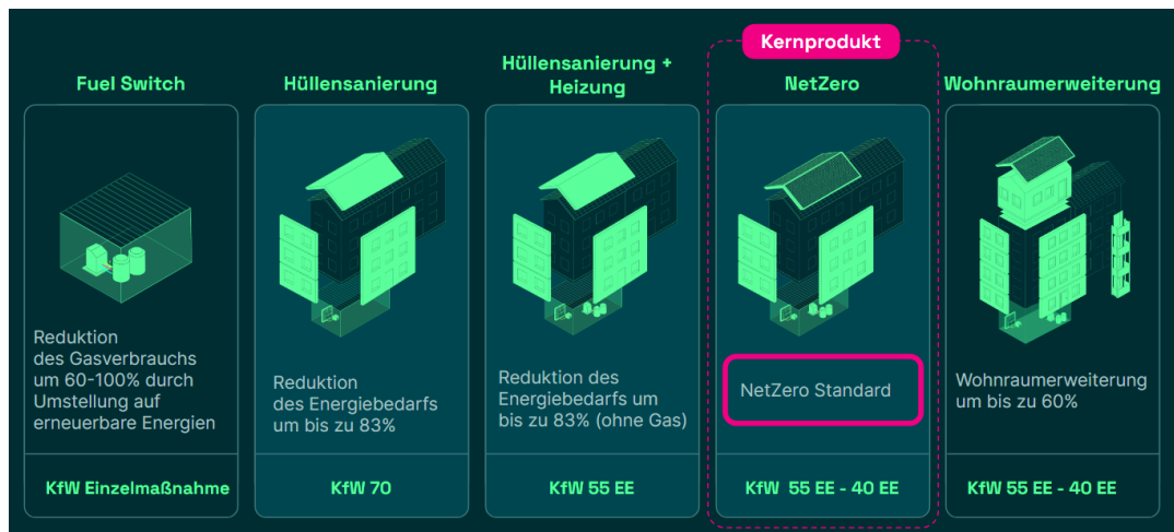
Abbildung 2: Produkte zur seriellen Sanierung von ecoworks

Ecoworks wurde 2019 in Berlin gegründet mit dem Ziel, CO 2 -Emissionen schnell zu reduzieren. Das Unternehmen saniert Bestandsgebäude, in der Regel Mehrfamilienhäuser, durch die Ummantelung mit einer hocheffizienten Gebäudehülle und modernen TGA-Lösungen. Es entwickelt darüber hinaus Produkte und Prozesse, die durch einen hohen Vorfertigungsgrad eine schnelle und kostengünstige serielle Sanierung des Gebäudebestands ermöglichen. Ecoworks plant, führt die Sanierungen selber aus und sichert die Eigenversorgung der Gebäude mit klimaneutralem Strom. Das Lösungskonzept wird auch "serielle Sanierung" genannt, weil bis zu 80% der Bauleistungen durch Vorfertigung seriell im Werk erfolgen und nur 20% auf der Baustelle. Mit diesem Verfahren plant ecoworks eine Gigatonne CO 2 -Emissionen bis zum Jahr 2045 einzusparen. Ein Kernprodukt bilden vorgefertigte industriell hergestellte Elemente für Fassade und Dach mit nachhaltigen Dämmstoffen und integrierter Gebäudetechnik sowie neuen hochdämmenden Fenstern, siehe. Abbildung 2.