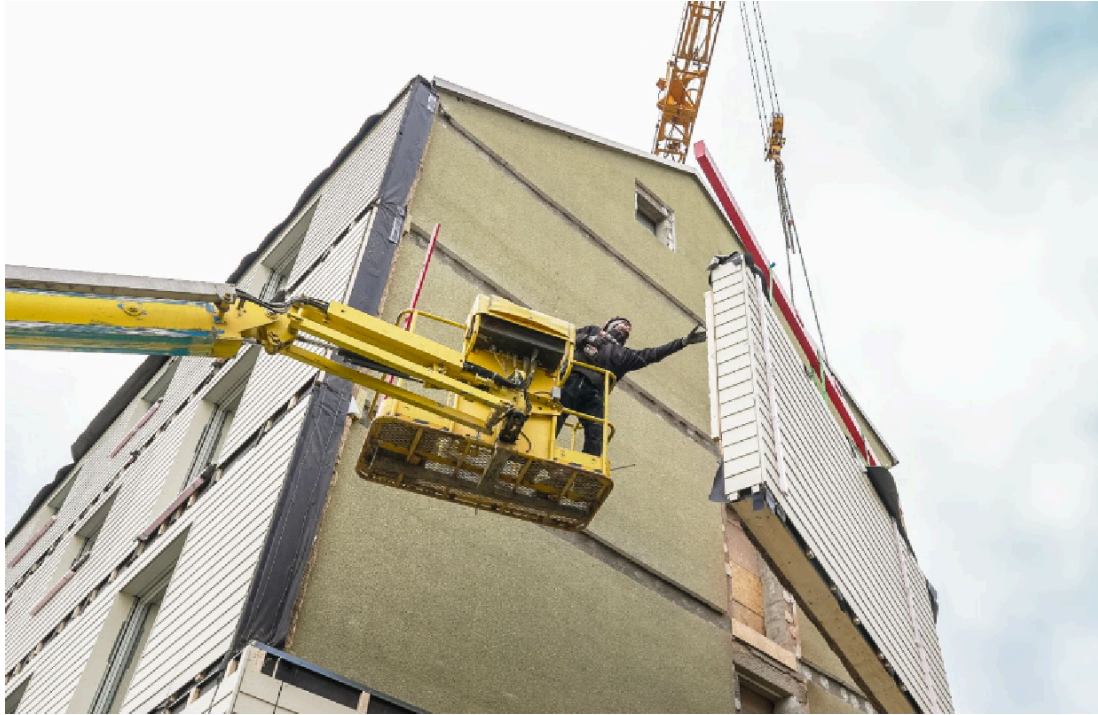
Abbildung 3: Montage von vorgefertigten Fassadenelementen

Was heutzutage in der Regel auf der Baustelle händisch gefertigt und installiert wird, kann in teilautomatisierten Fabriken von Robotern und auf Fertigungsstraßen produziert und direkt als fertige Bauteile der Gebäudehülle auf die Baustelle gebracht und dort schnell montiert werden, siehe Abbildung 3.