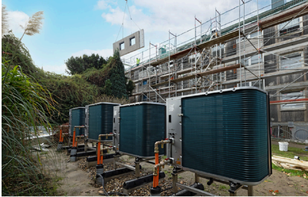
Abbildung 6: Luft-Wasser-Wärmepumpentechnik